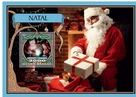
Guinea Bissau – Klb. & Block Weihnachten 2016 – Bestell-Nr.: 1616231 + 1616232